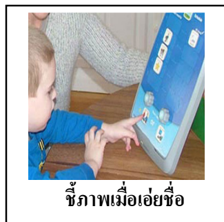
ชี้ภาพเมื่อเอ่ยชื่อ