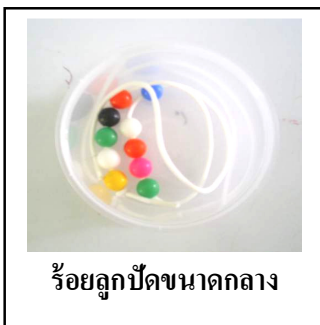
ร้อยลูกปัดขนาดกลาง