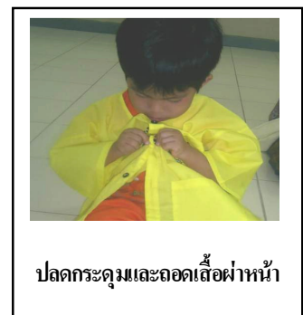
ปลดกระดุมและถอดเสื้อผ่าหน้า