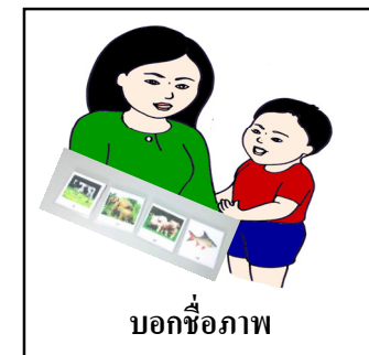
บอกชื่อภาพ