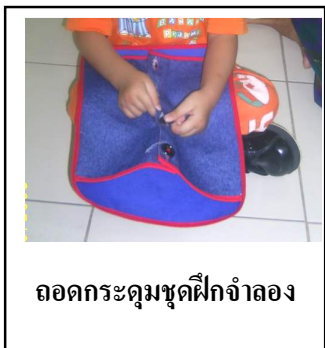
ถอดกระดุมชุดฝึกจำลอง