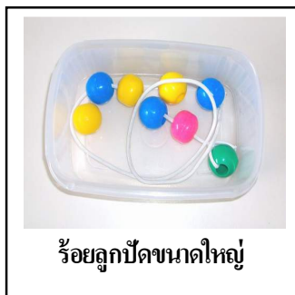
ร้อยลูกปัดขนาดใหญ่