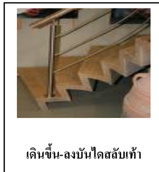
เดินขึ้น-ลงบันไดสลับเท้า