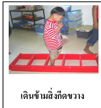
เดินข้ามสิ่งกีดขวาง