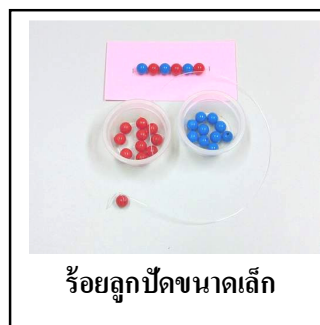
ร้อยลูกปัดขนาดเล็ก