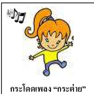
กระโดดเพลง “กระต่าย”