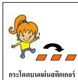
กระโดดบนแผ่นสติ๊กเกอร์