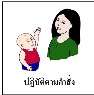
ปฏิบัติตามคำสั่ง