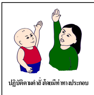
ปฏิบัติตามคำสั่งโดยมีท่าทางประกอบ