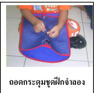
ถอดกระดุมชุดฝึกจำลอง