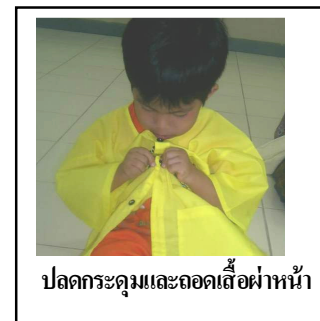
ปลดกระดุมและถอดเสื้อผ้าหน้า