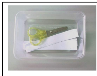
ตัดกระดาษขนาด 2 ซม.