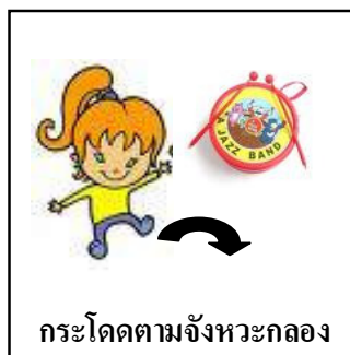
กระโดดตามจังหวะกลอง