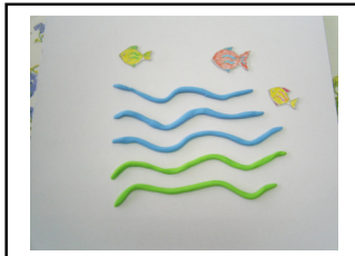
ทะเลแสนงาม