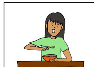
ใช้ช้อนตักอาหาร