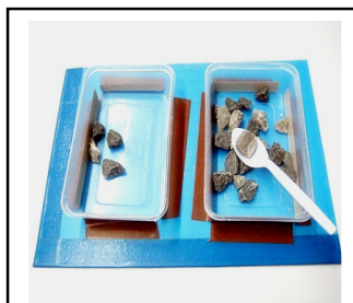
ตักสิ่งของลงกล่อง