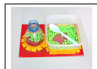
ตักลูกปัดใส่ขวด