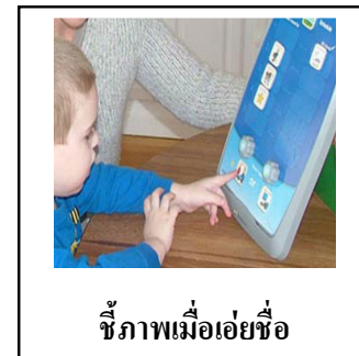
ชี้ภาพเมื่อเอ่ยชื่อ