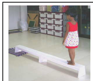
เดินเก็บของบนกระดานทรงตัว