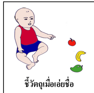
ชี้วัตถุเมื่อเอ่ยชื่อ