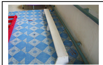
เดินจับราวบนกระดานทรงตัว