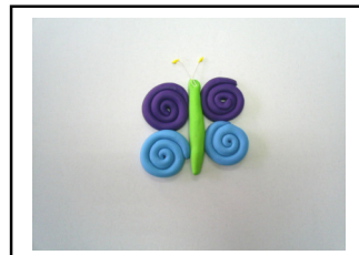
ผีเสื้อน้อย