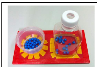
หยิบลูกปัดใส่ขวด