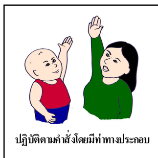
ปฏิบัติตามคำสั่งโดยมีท่าทางประกอบ