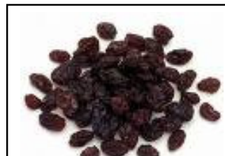
หยิบลูกเกด