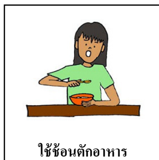
ใช้ช้อนตักอาหาร