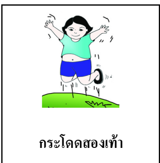
กระโดดสองเท้า