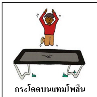
กระโดดบนแทมโพลีน