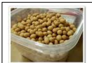
หยิบขนมโก๋แก่