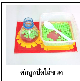
ตักลูกปัดใส่ขวด