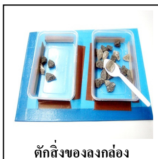
ตักสิ่งของลงถาด