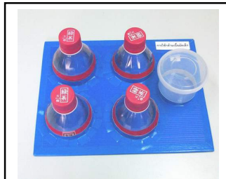
หมุนเปิดปิดฝาขวด