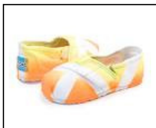
ถอดรองเท้าหุ้มส้น