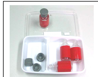
หมุนเปิด - ปิดขวดฝาเกลียว