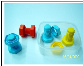
หมุนน็อตของเล่น