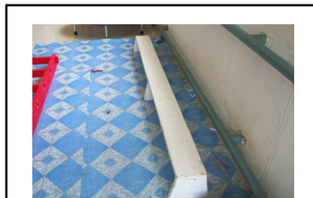
เดินบนกระดานทรงตัวมือจับราว