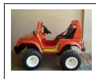
รถของเล่น