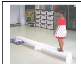
เดินเก็บของบนกระดานทรงตัว