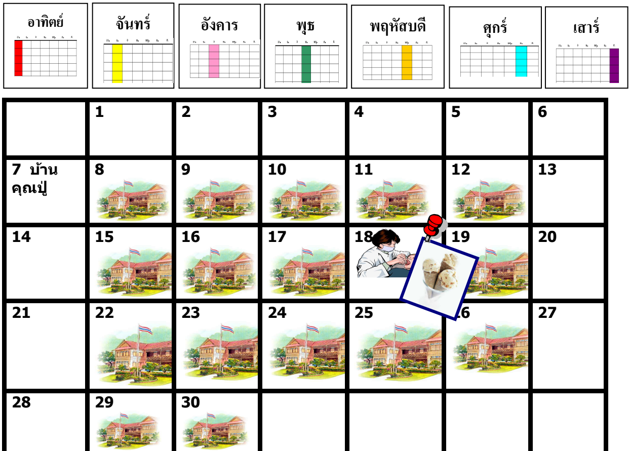
รูปที่ 8.17 ปฏิทินให้ข้อมูลล่วงหน้า

สิ่งสำคัญที่ฉันควรจำ เดือน มิถุนายน 2552